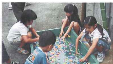
模擬売店とゲームクジなど