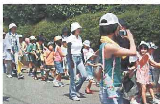
子ども会の神輿巡幸