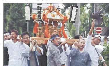
子ども会と長栄会宮入り